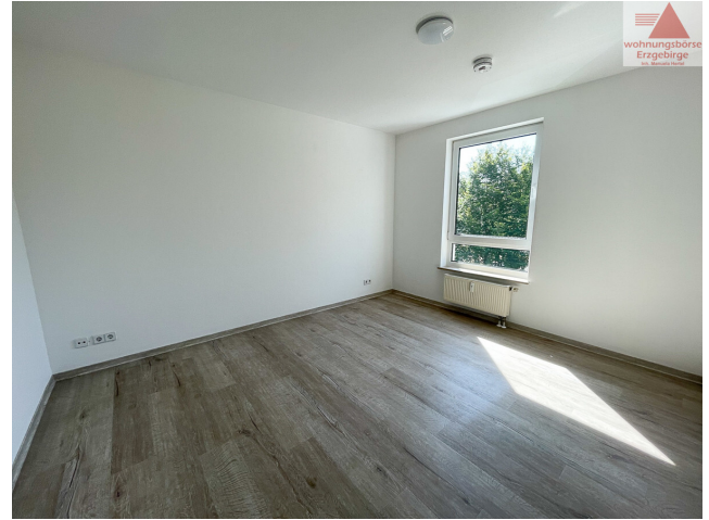
Beispiel Schlafzimmer (2)