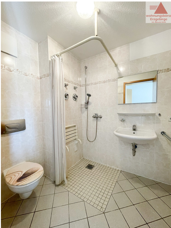
Beispiel Bad (2)