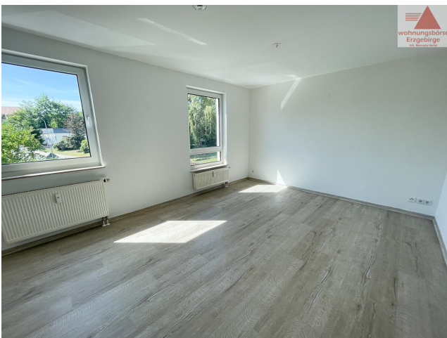
Beispiel Schlafzimmer (3)