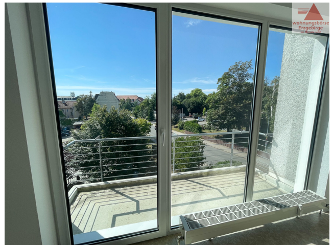
Beispiel Balkon (3)