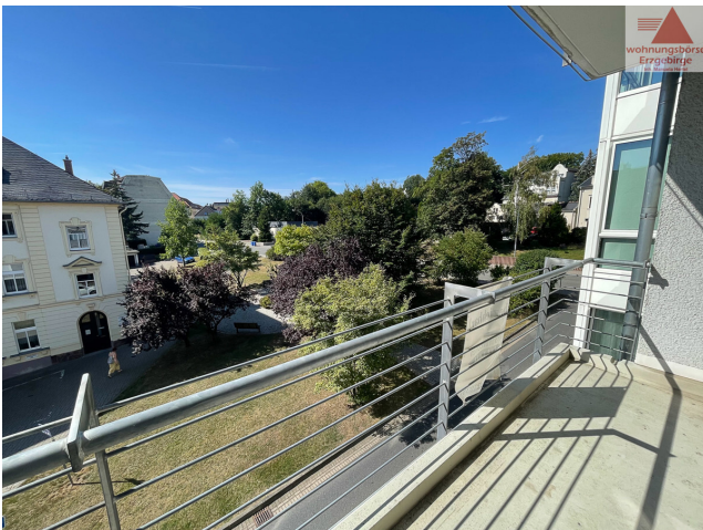
Beispiel Balkon (2)