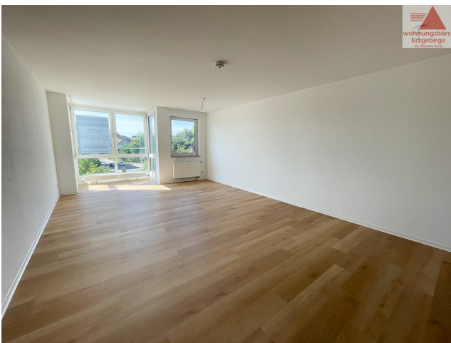
Beispiel Wohnzimmer (2)