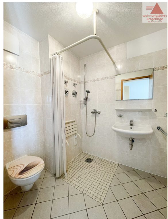
Beispiel Bad (2)