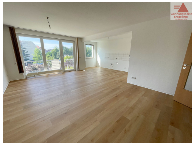
Beispiel offener Küchenbereich