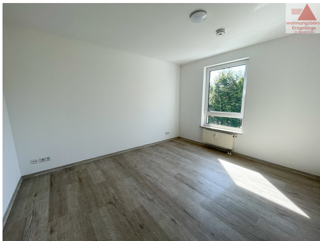
Beispiel Schlafzimmer (2)