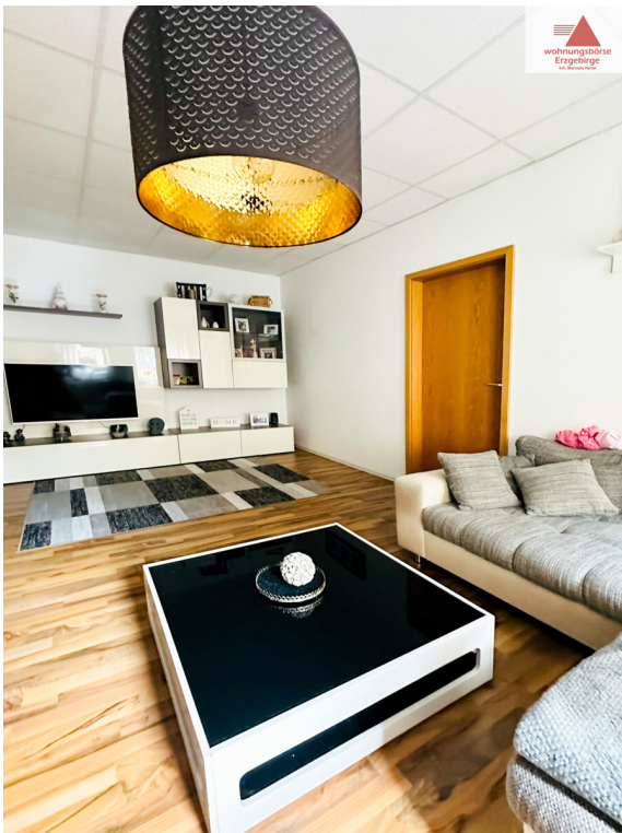
Wohnzimmer 1. OG