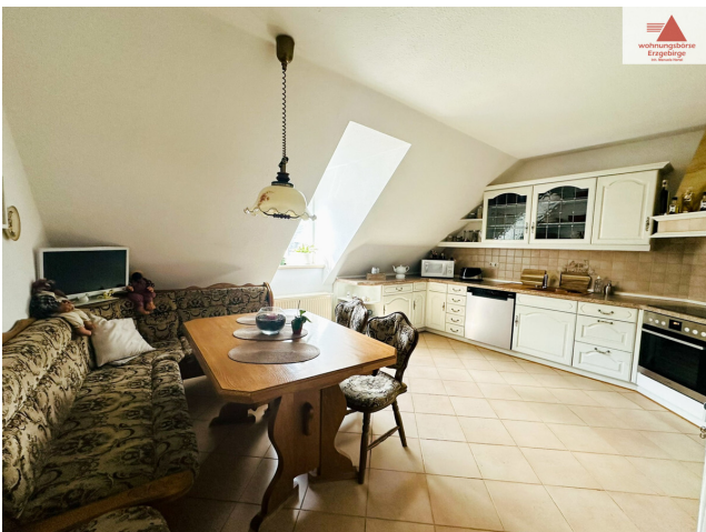
Küche 2. OG