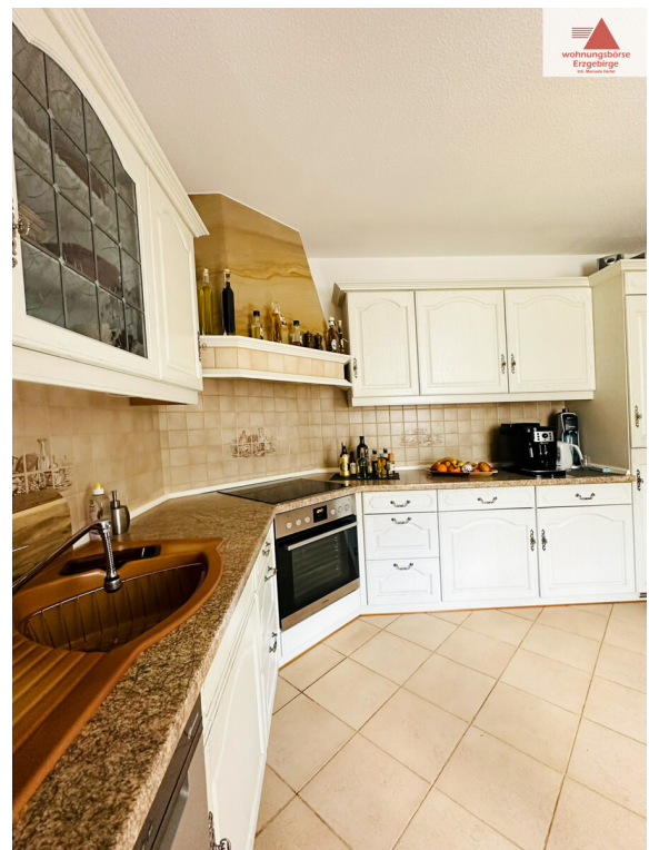
Küche 2. OG