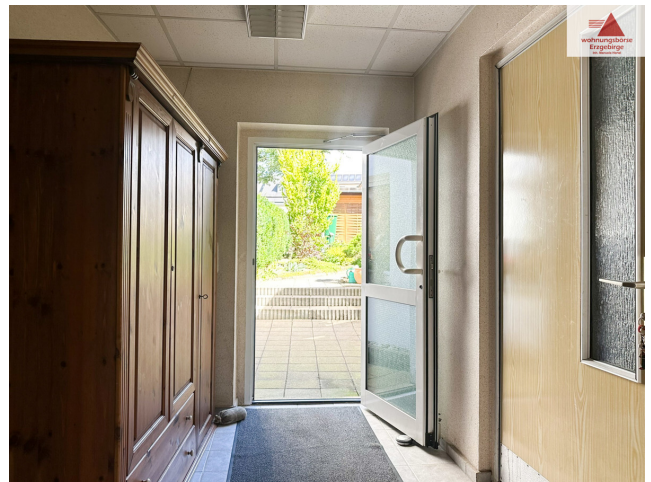
Ausgang vom Wohnbereich in den Garten