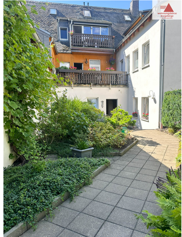
Hausrückseite mit Garten