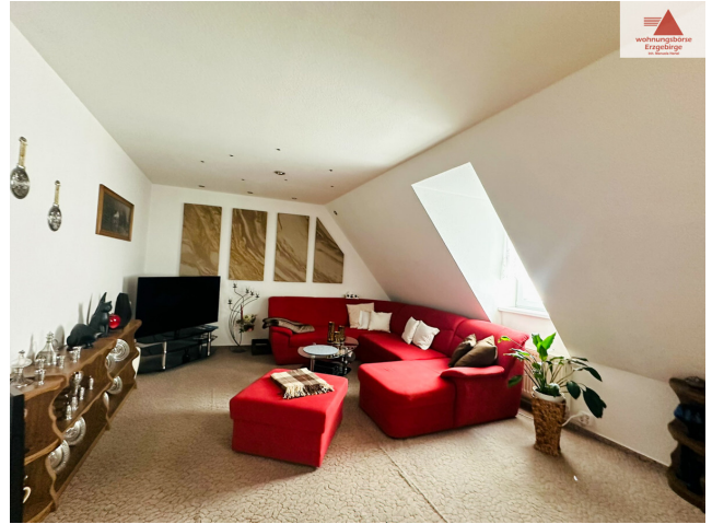
Wohnzimmer 2. OG