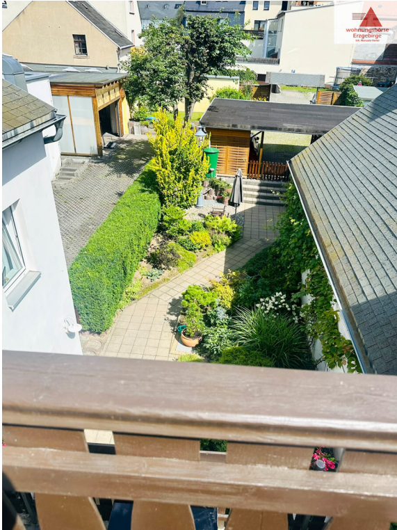
Blick vom Balkon in den Garten