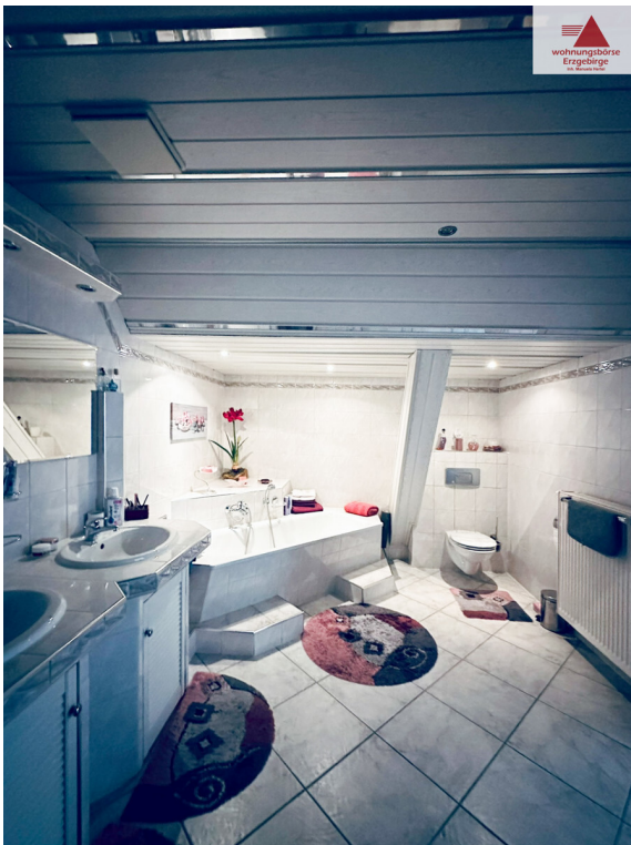
Badezimmer 2. OG