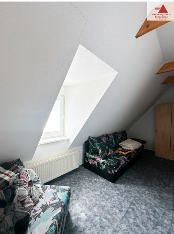
Zimmer 2 DG