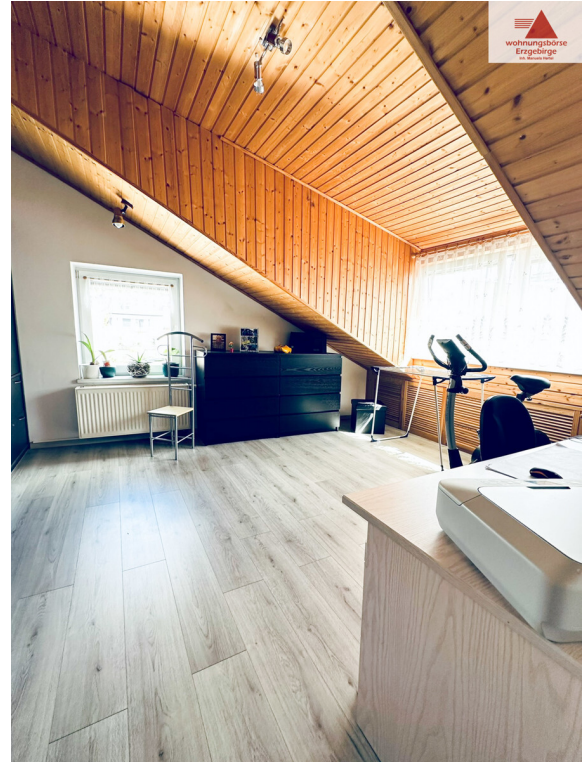
Arbeitszimmer 2. OG