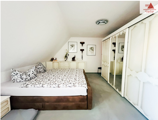
Schlafzimmer 2. OG