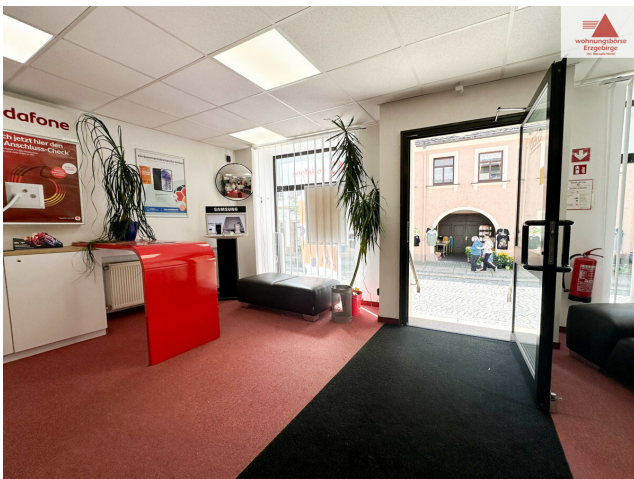
Zugang Gewerbe EG