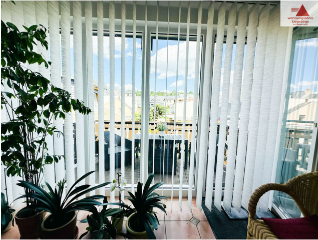
Zugang Balkon 2. OG