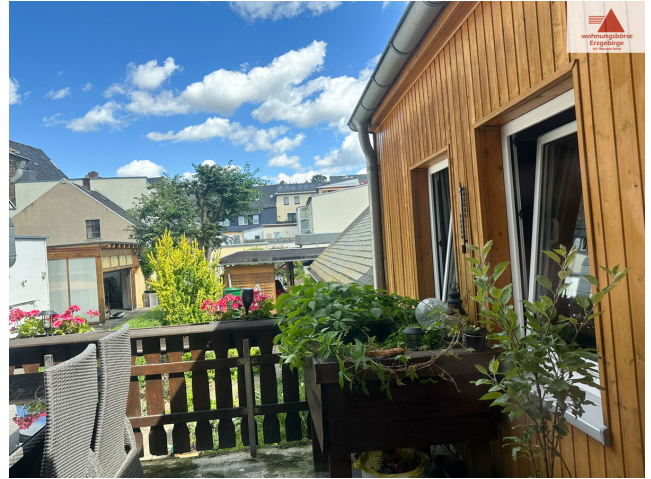
Balkon 1. OG