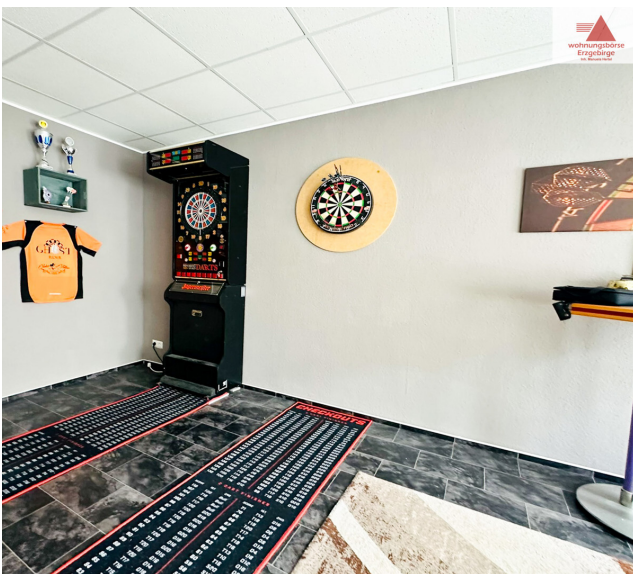
Hobbyraum im Anbau