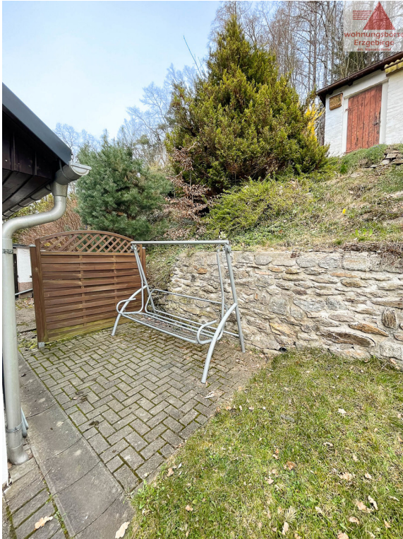
Terrasse hinterm Haus