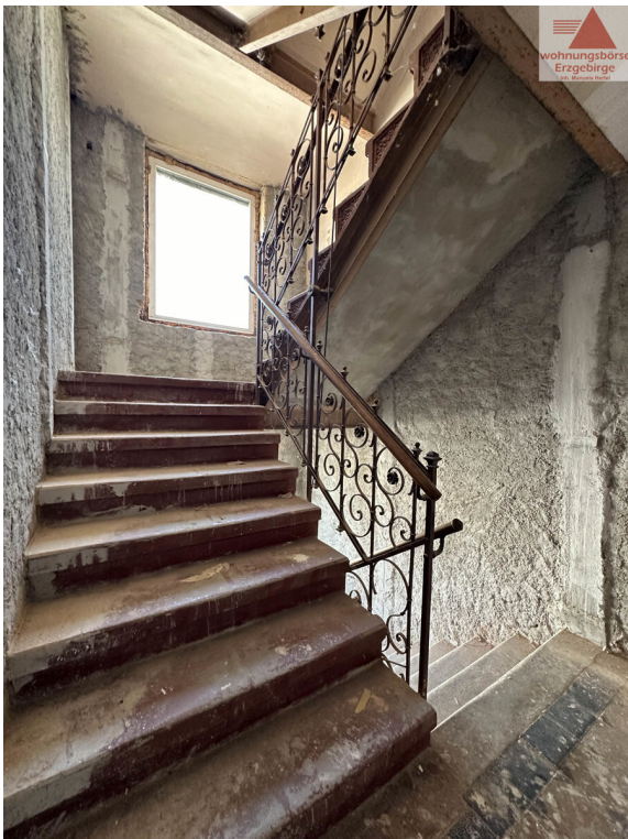
Treppe zum DG