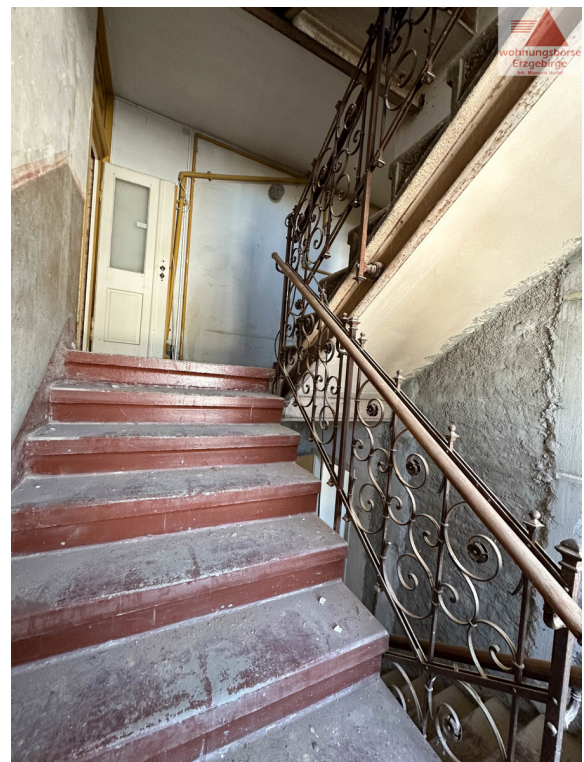
1.OG zu 2. OG