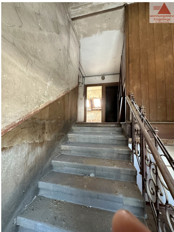
Hausflur zum DG