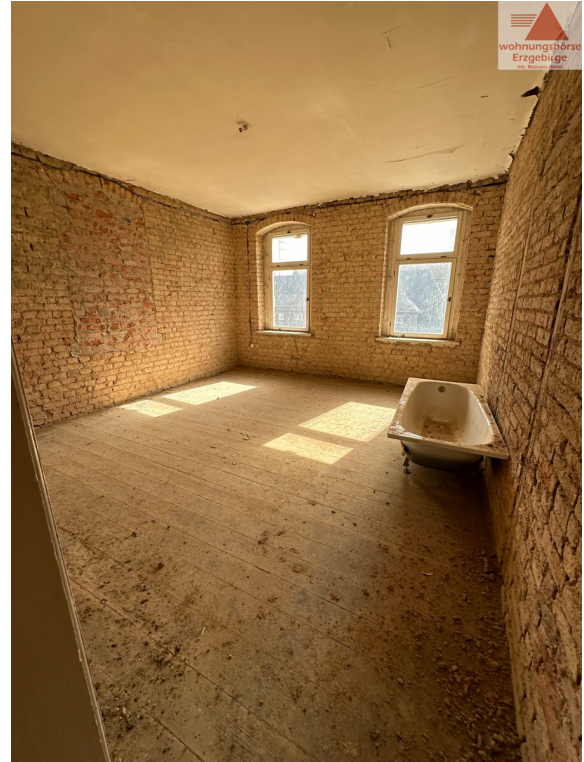
Wohnen 2. OG