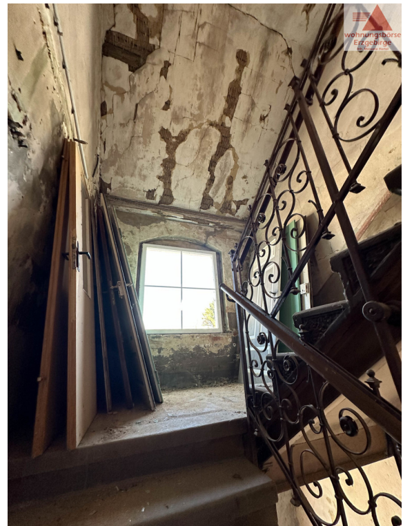
Flur zum DG