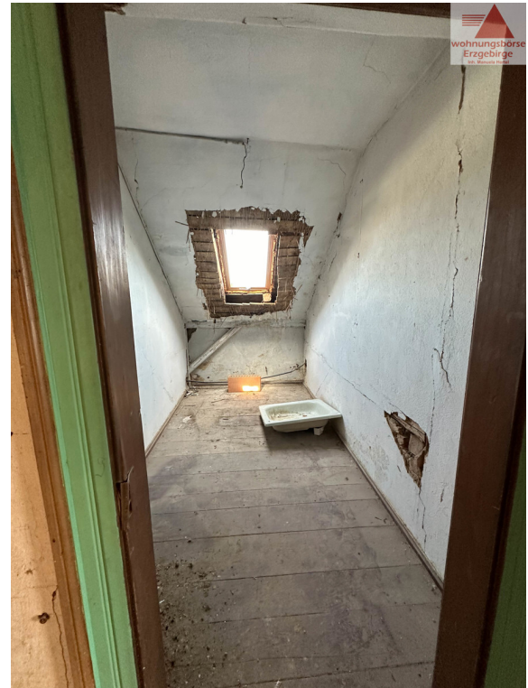
Gäste WC DG