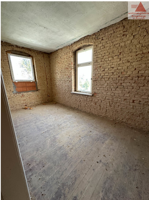
KiZi 2. OG