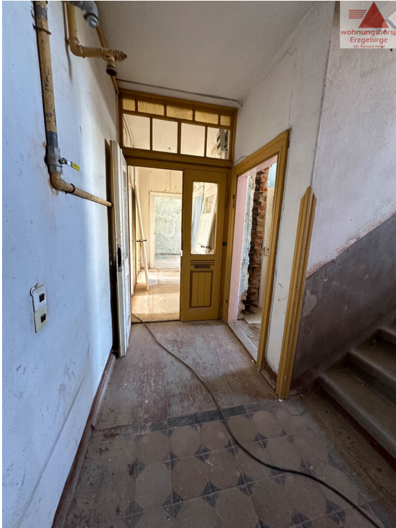
Hausflur 2. OG