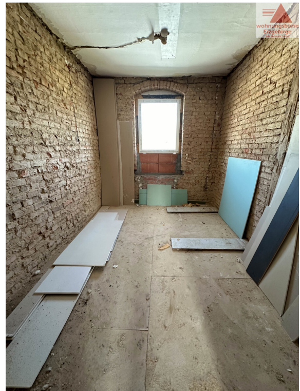
Küche 2. OG