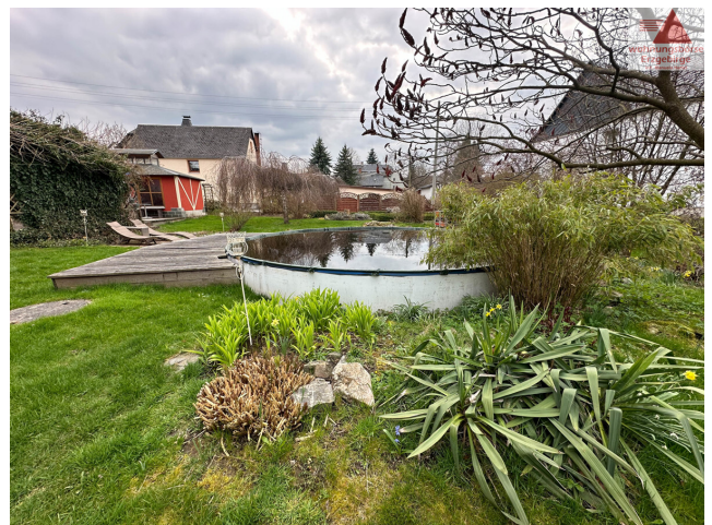
Grundstück mit Pool