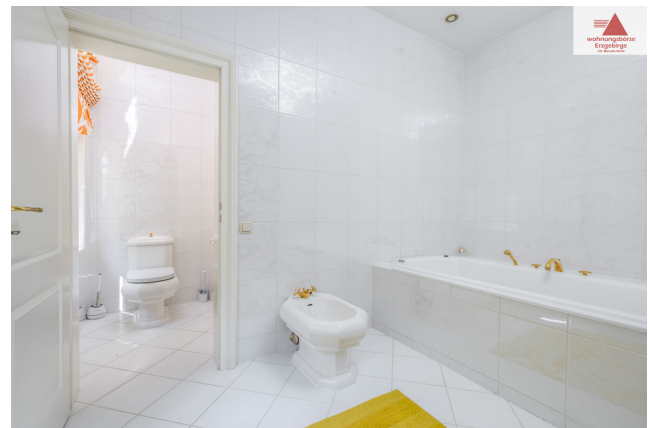
Bad 1. OG