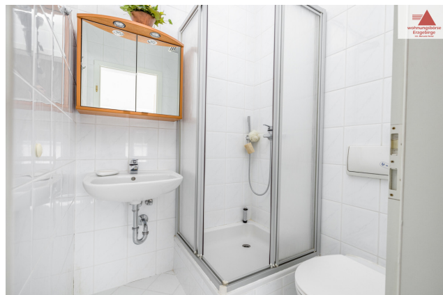
Duschbad 2. OG