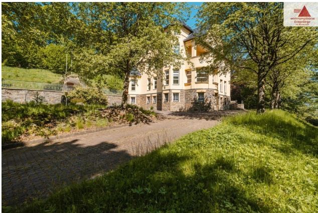
Blick von Zufahrt