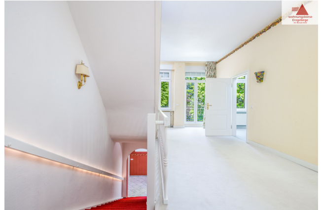
Flur 1. OG