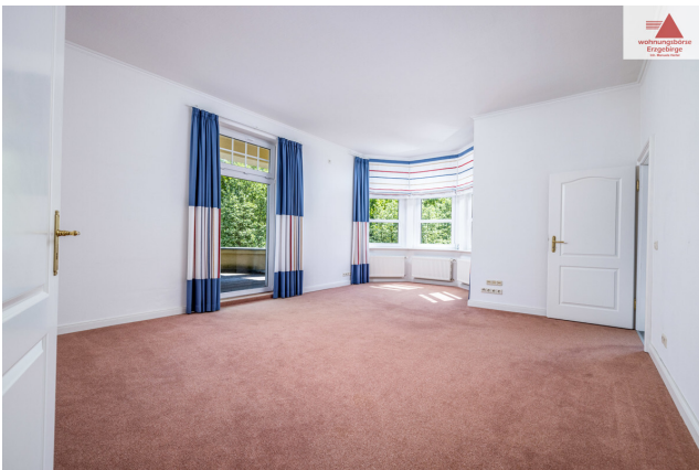
Zimmer 1. OG mit Zugang Balkon