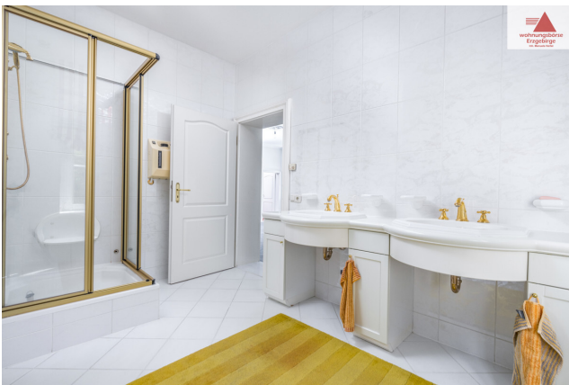
Bad 1. OG