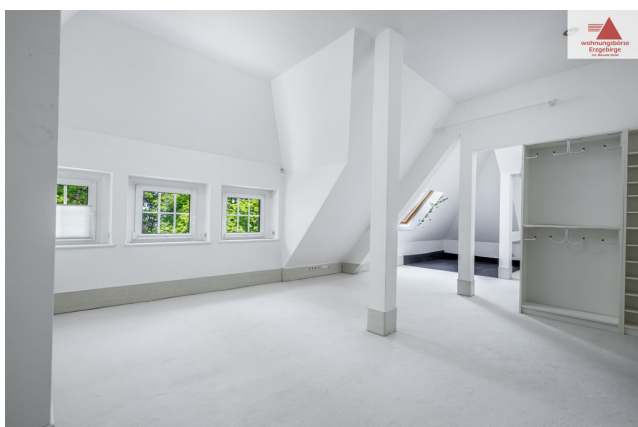
Zimmer 2. OG