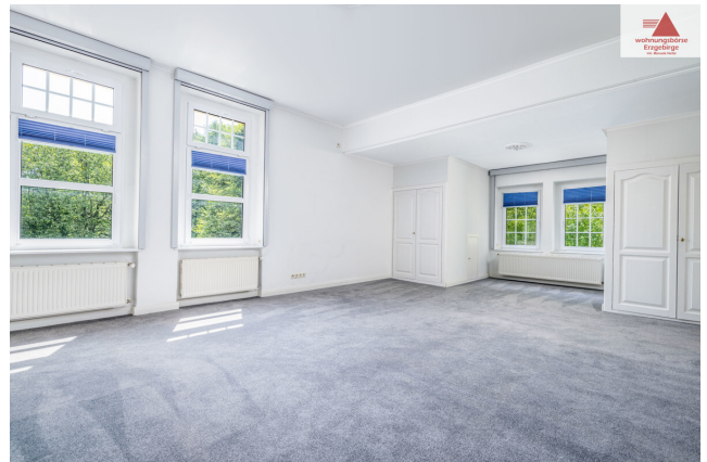
Zimmer 1. OG