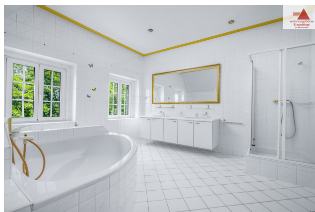
Badezimmer 2. OG