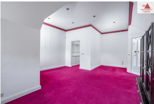
Zimmer 2. OG