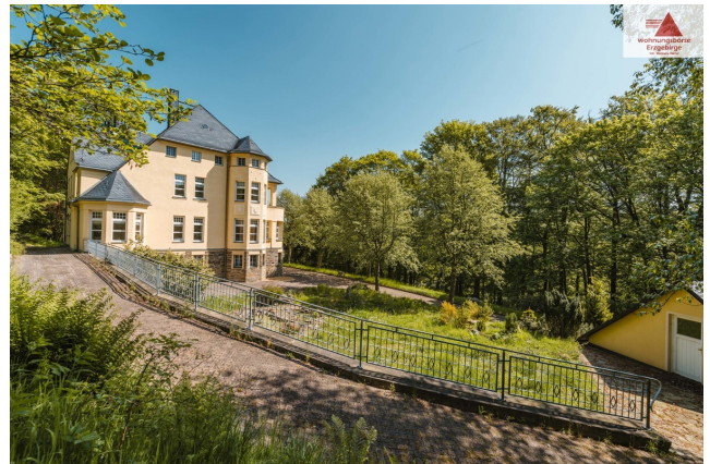
Blick vom Grundstück