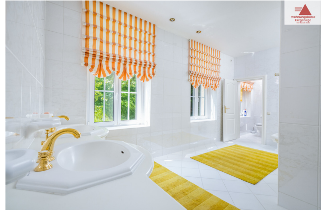
Bad 1. OG