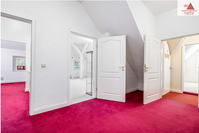
Flur 2. OG