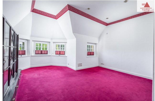
Zimmer 2. OG