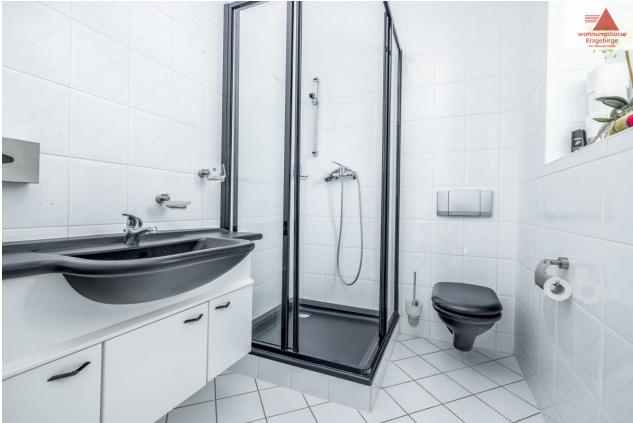
Duschbad 1. OG