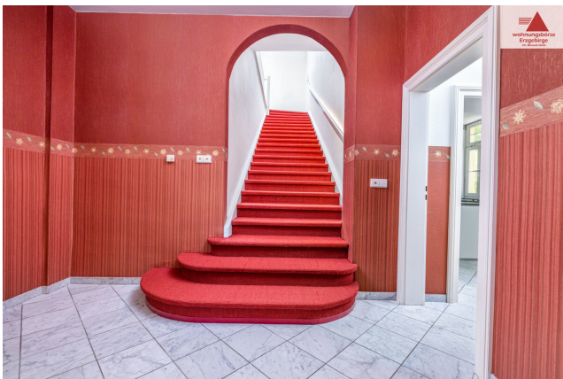
Treppe zum OG