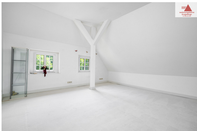
Zimmer 2. OG