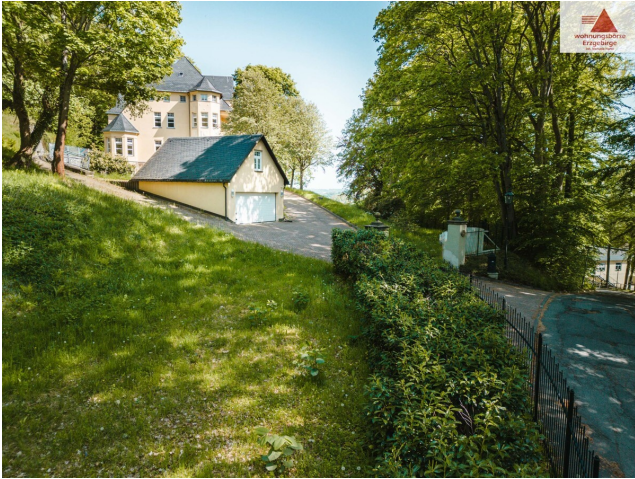
Zufahrt mit Garage