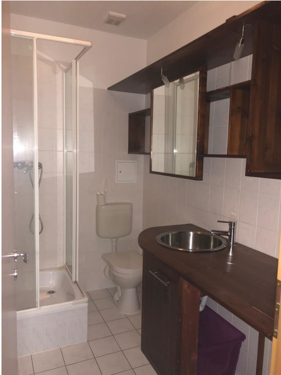
Bad OG 1