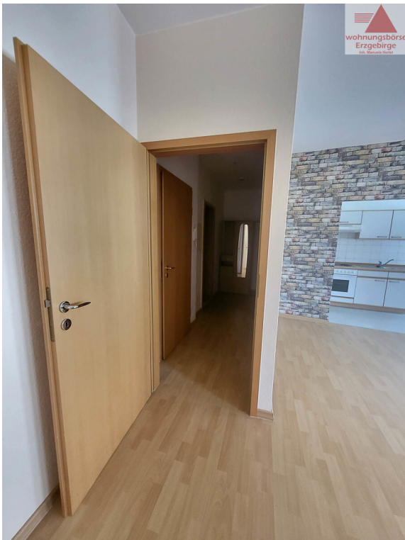
Flur OG 2