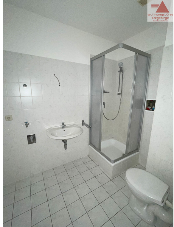
Bad OG 2