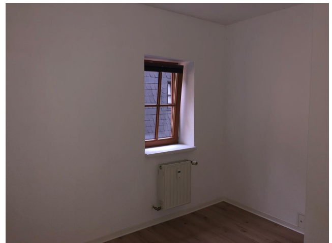
Schlafzimmer OG 1