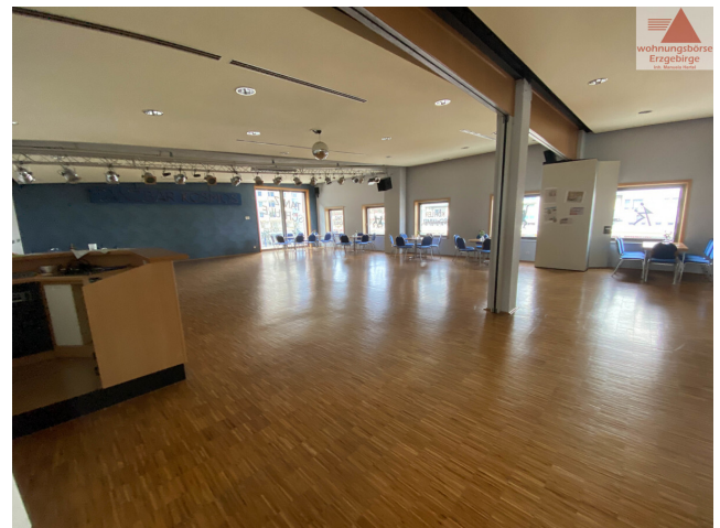
Tanzsaal I OG