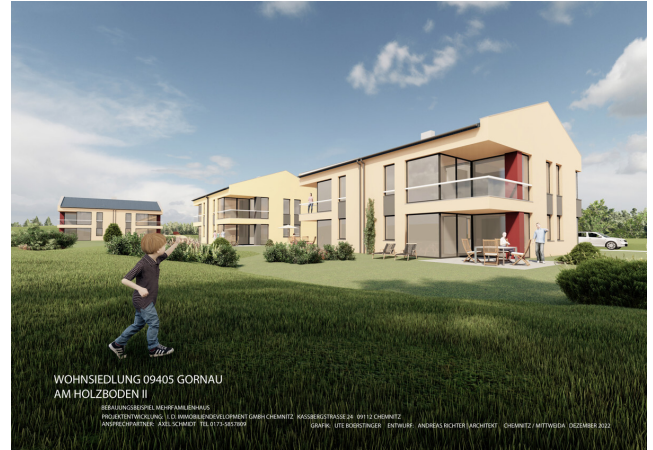
BV Gornau - MFH klein