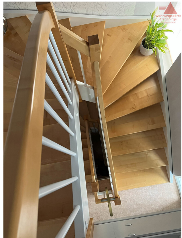
Treppe zu Etagen