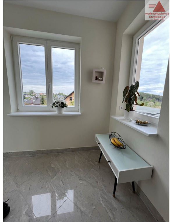
Windfang mit Ankleide