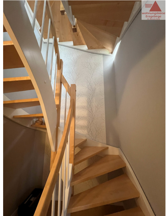
Treppe ins EG