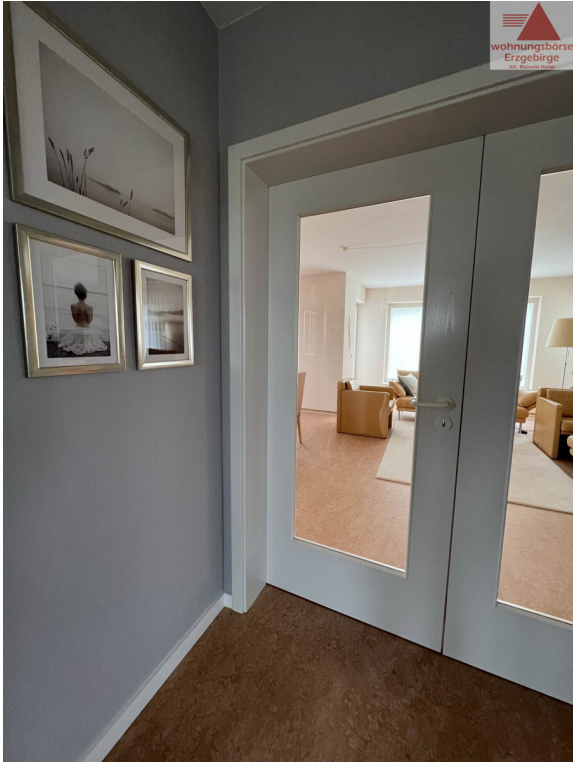
Flur zu Wohnen