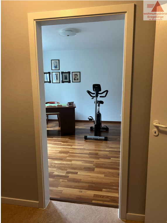
Blick ins Arbeitszimmer