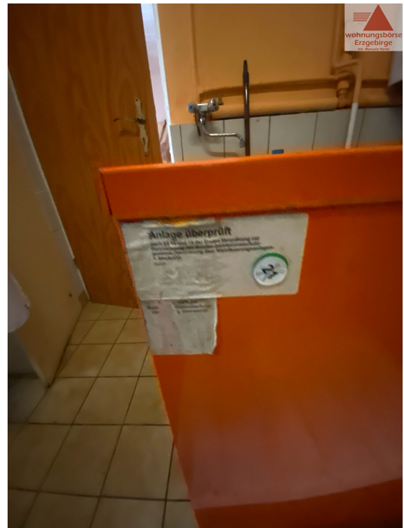
Therme außer Betrieb