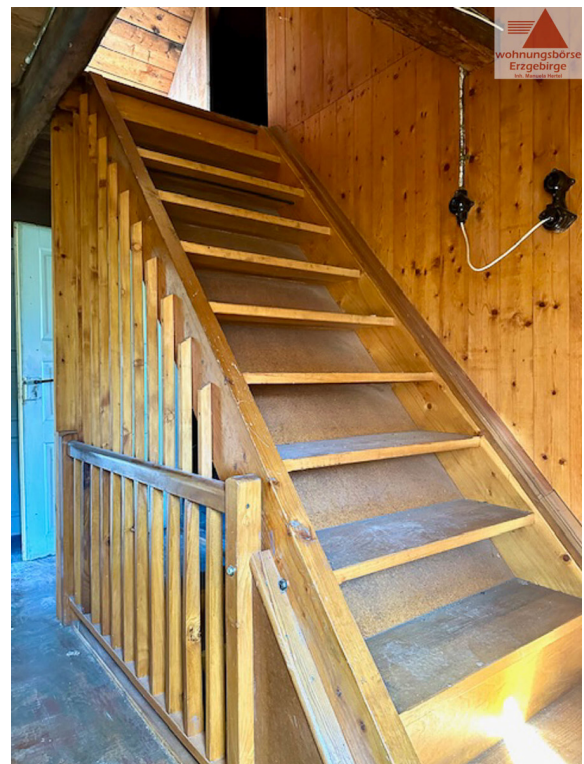
Treppe zum Boden