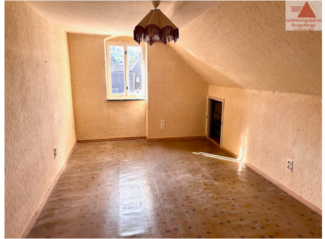
Zimmer 2 Dachgeschoss