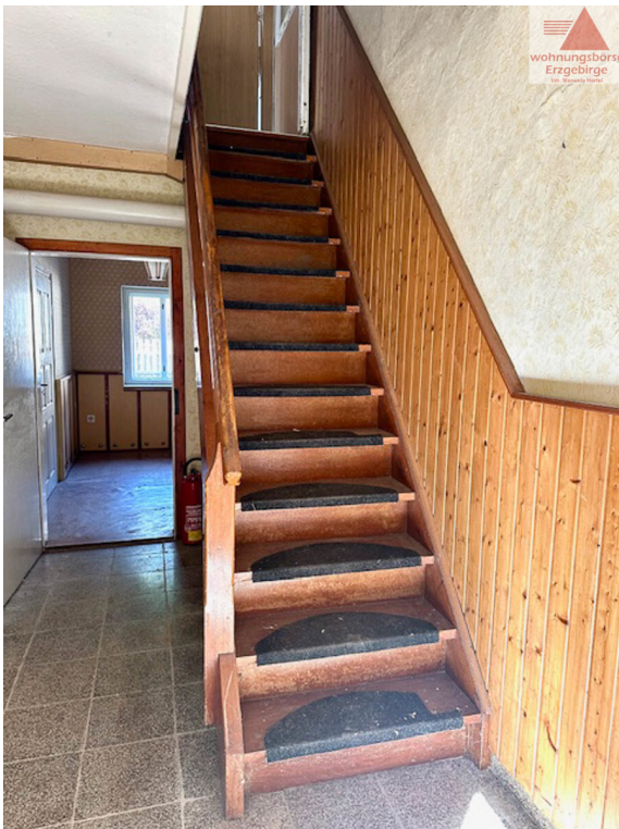
Treppe ins Obergeschoss