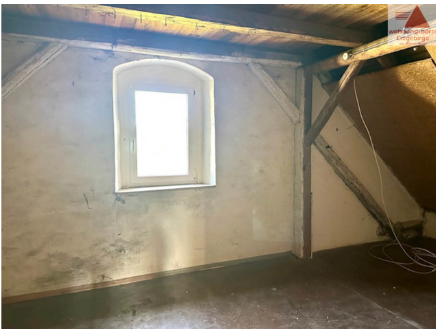
Zimmer 3 Dachgeschoss