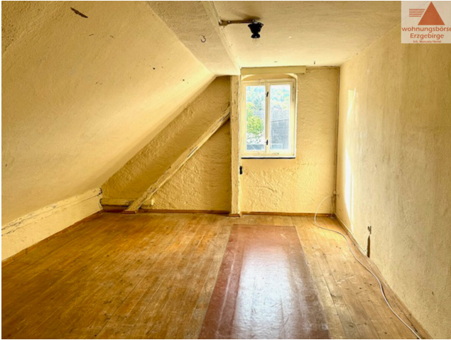
Zimmer 1 Dachgeschoss