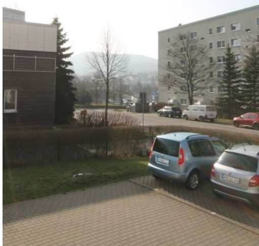
Blick zum Pöhlberg