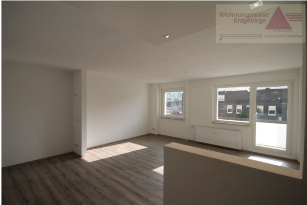
Blick aus dem Küchenbereich