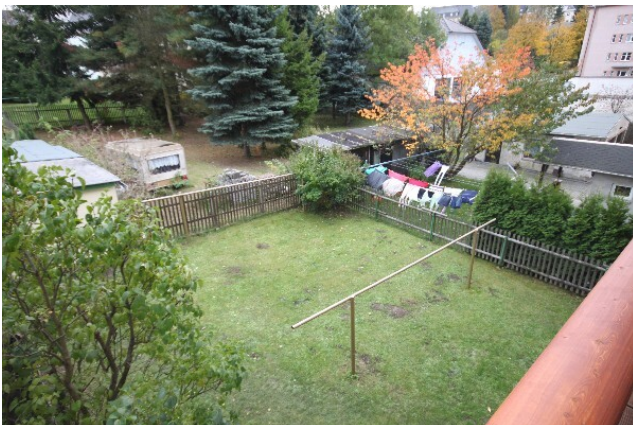
Blick in Garten