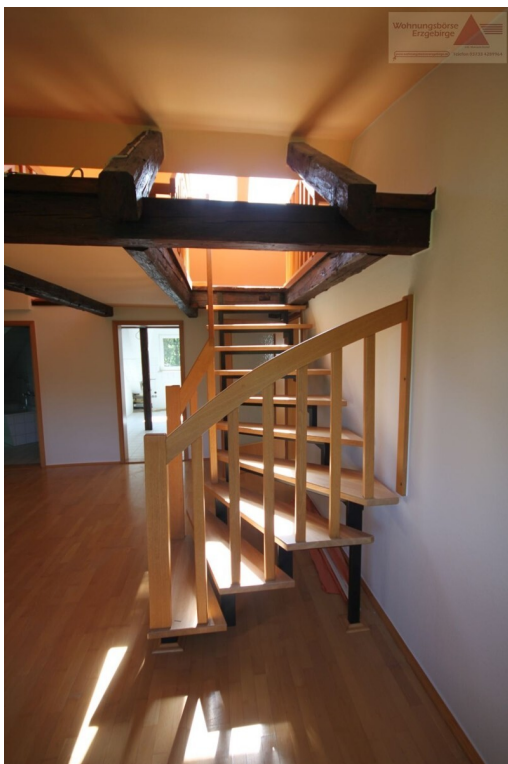
Treppe zur Empore